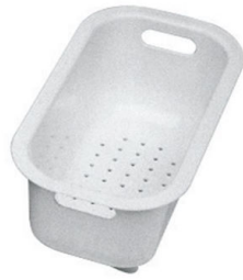
Scolapasta bianco 8151 100